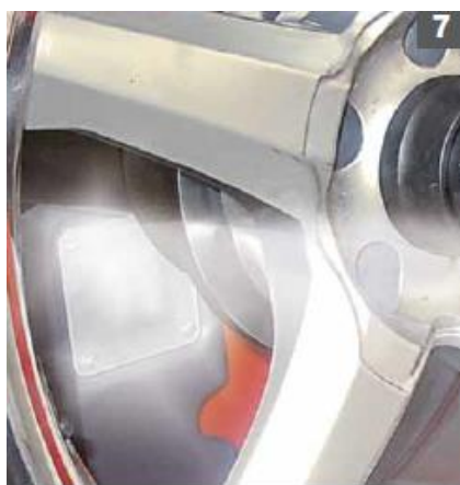
LED osvětlení vnitřku ráfku

Automatické polohování kola do místa nevývažku