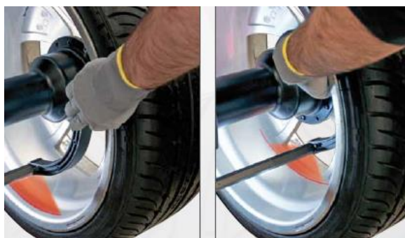
Elektronické měřicí vnitřní ramínko s integrovaným laserem eliminuje chyby obsluhy při zadávání rozměrů