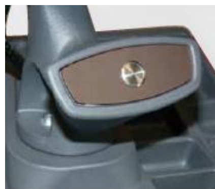
Univerzální navigační tlačítko a přepínání poloh kola do rovin nevývažků

EASY WEIGHT – patentovaný program na optimalizaci závaží v závislosti na charakteru vyvažovaného kola