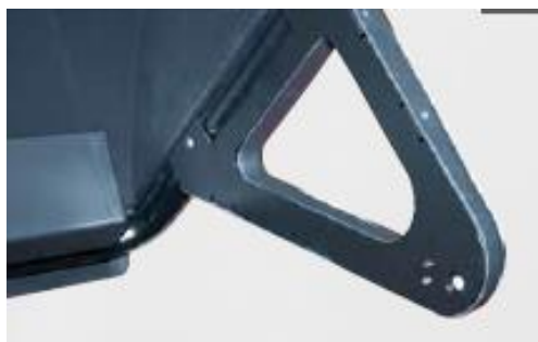
Automatické měření šířky ráfku sonarem