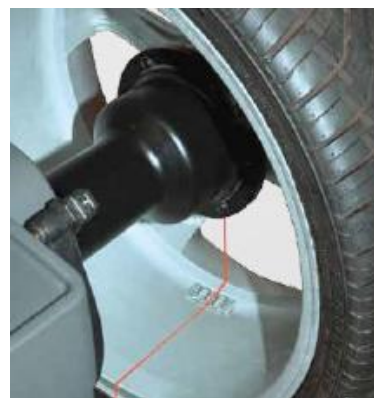
Liniový laser na „6h“ určuje přesnou pozici nalepovacího závaží